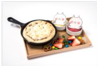
“うさまる”“うさこ”のダブルチョコフォンデュ ¥1,900 (税込み)