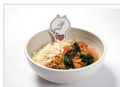
ちゅるるるバターチキンカレーうどん ¥1,490 (税込み)