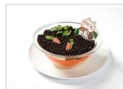
収穫の喜びチーズケーキ ¥1,166 (税込み)