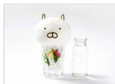
うさまるソーダ～バジルミントソーダ～ ¥1,058 (税込み)