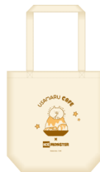
トートバッグ (全2種) ¥1,350 (税込み)