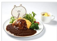
ほっぺがおちそうオムライス ¥1,706 (税込み)