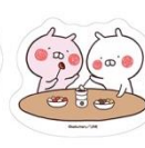
ダイカットステッカー (全4種) ¥378 (税込み)